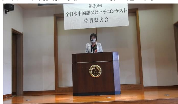
西早蘭審査委員長講評:発表者の正確な発音、豊かな表現に日頃の成果を発揮され審査員一同感心いたしました。