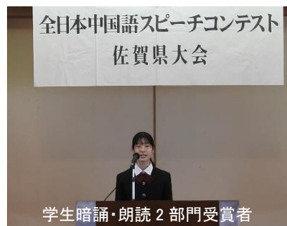
学生暗誦・朗読2部門受賞者