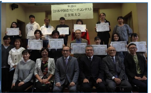
審査発表後、喜びの受賞者記念撮影