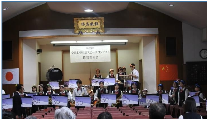
審査発表前の龍谷高校吹奏楽部による華麗な演奏に