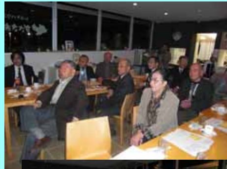
興味ある講義に聞き入る参加者の皆さん