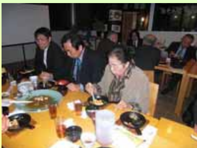
講義の感想を話しながらの会食

中国では「調理は中華、住まいは洋館、妻は日本女性」と言われてきた。何故、妻は日本女性なのか。唐先生の研究の原点はここから。