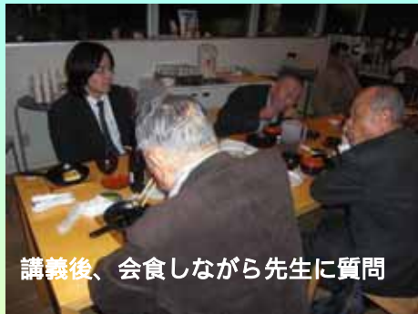
講義後、会食しながら先生に質問