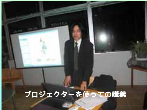
プロジェクターを使っでの講義